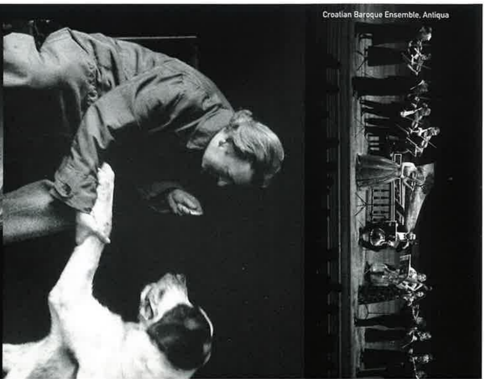
Croatian Baroque Ensemble, Antiqua